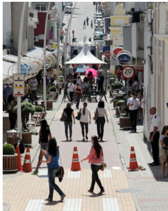
Pedestres circulam pela nova rua Vidal Ramos. (Foto: Divulgação).

Os custos totais da obra foram de R$700mil. Os principais itens de custo foram: infraestrutura, mobiliário, fachadas. A Secretaria Municipal de Obras investiu R$ 480.000,00. Trinta e quatro lojistas também participaram do financiamento das obras e investiram R$122.240,00, em 18 parcelas de R$200,00. Além disso, cada lojista custeou o toldo padronizado e a pintura de sua loja, cujo valor individual foi de R$ 3.600,00 a R$ 9.200,00, variando conforme a extensão da fachada. O mobiliário urbano (bancos, lixeiras e floreiras) somou R$40.570,00, que foram custeados pela ACIF. As flores e plantas foram doadas por iniciativa de um lojista (Lojas Koerich) e por uma incorporadora (Empreendimentos Imobiliários Zita).