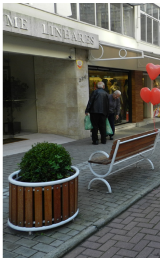
Vista da Rua Vidal Ramos com lixeira, bancos e floreiras instaladas (Foto: Divulgação).