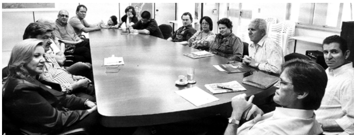
Reunião entre os parceiros do projeto de Requalificação da Rua Vidal Ramos.