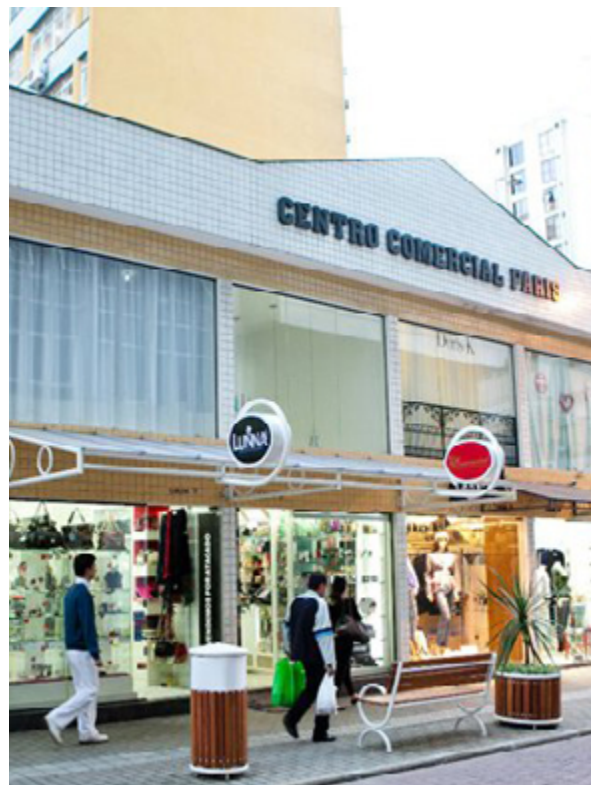
Pintura colorida destaca prédio histórico e uso da cor branca nos demais estabelecimentos homogeneiza paisagem e ressalta identificação das lojas (Foto: Divulgação).