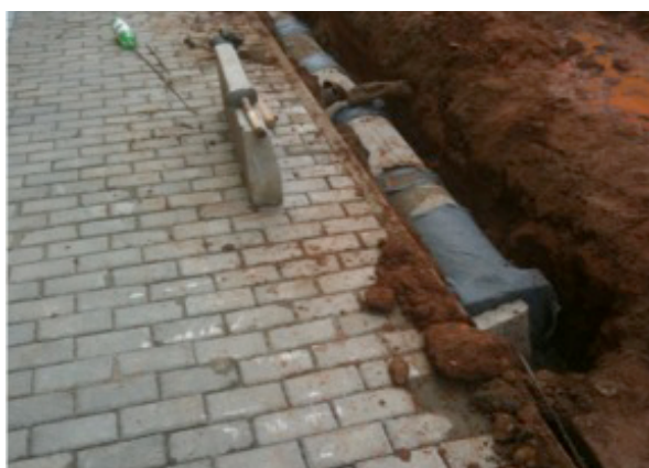
Obras de aterramento de cabos e instalação de nova tubulação de esgoto e drenagem.