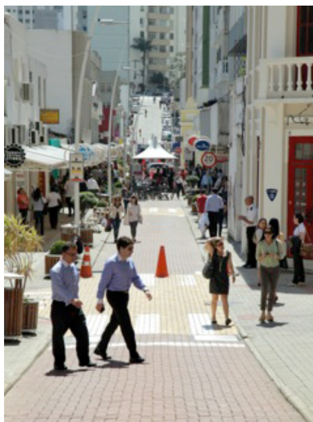
Rua Vidal Ramos após requalificação

A inauguração ocorreu em 2012, após 5 anos de planejamento e obras. Assim que as lojas liberaram de suas fachadas as placas e letreiros, ressurgiu a arquitetura das casas de uma das ruas mais charmosas do centro histórico da cidade. As calçadas foram alargadas e o estacionamento de automóveis foi restrito a duas vagas para idosos, uma para portador de necessidades especiais e foi permitida a parada apenas para embarque e desembarque rápido de pedestres e mercadorias. A velocidade máxima para automóveis foi reduzida para 20Km/h, reafirmando, em conjunto com as demais medidas, a prioridade do pedestre no local. A partir da inauguração intensificaram-se os trabalhos de vitrinismo, visual merchandising e treinamento de funcionários.