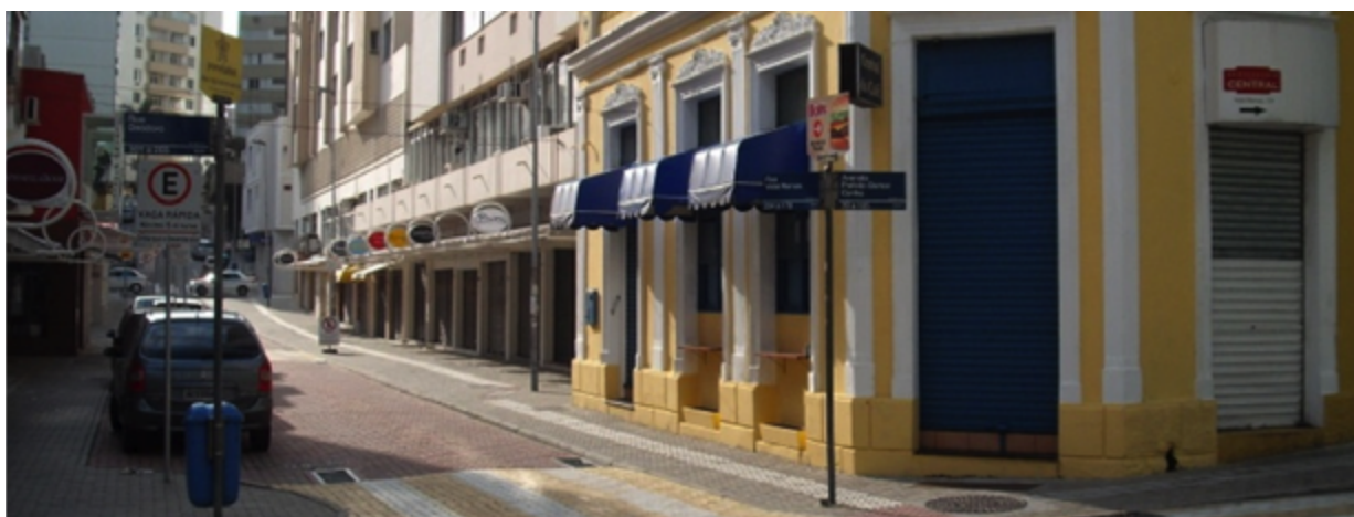
Obras de troca de pavimento na via e nas calçadas e aspecto final da rua: cores indicam preferência de uso do espaço.