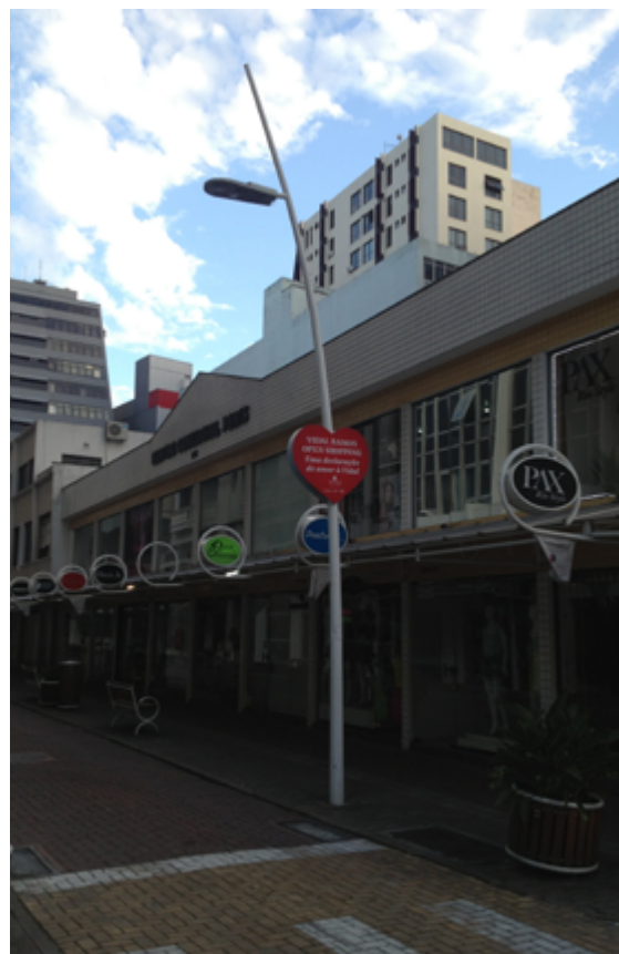
Poste de Iluminação com iluminação de Led.

O mobiliário urbano adotado foi exclusivamente projetado para a Rua Vidal Ramos e doado pela ACIF. Ao todo foram implantados 20 bancos, 40 lixeiras e 40 floreiras a um custo total de R$40.570,00. Também foi permitido que os bares e restaurantes colocassem mesas no espaço público, respeitando a faixa máxima de 80 cm junto à fachada do estabelecimento ou em locais pré-aprovados pelo Instituto de Planejamento Urbano de Florianópolis (IPUF).