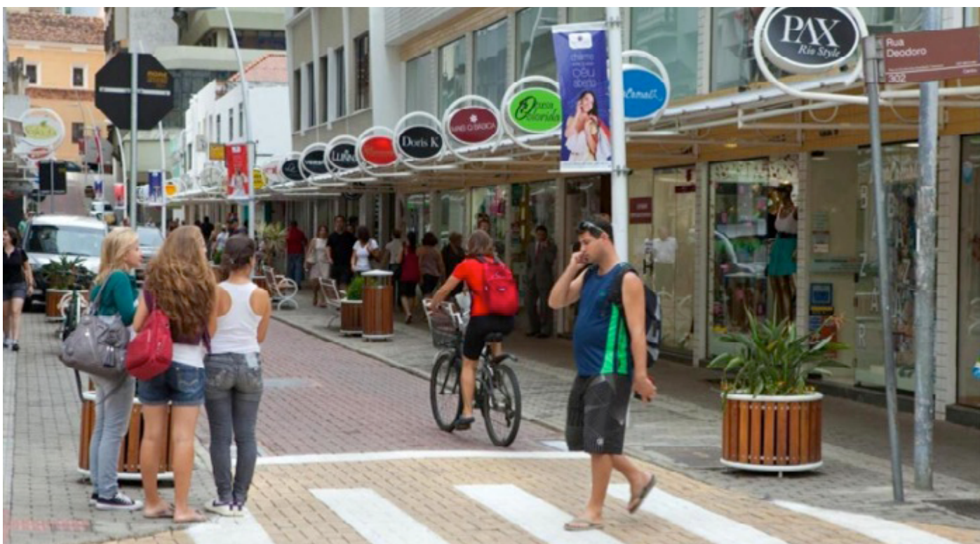
Rua Vidal Ramos após requalificação